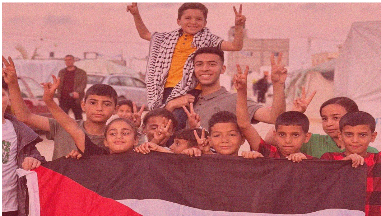
Palestina: Declaración de la AIP sobre el Acuerdo de alto al fuego