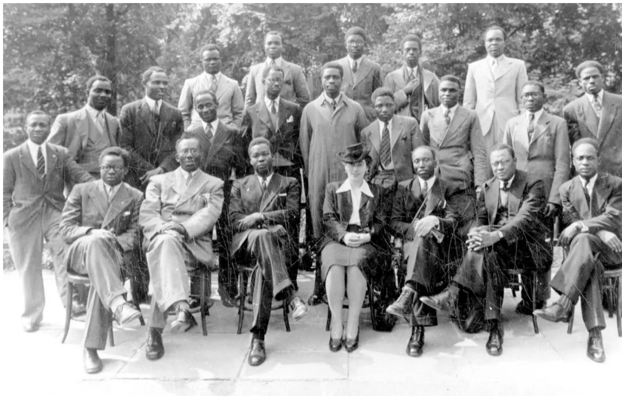
80 años desde el V Congreso Panafricano de 1945, forjando el camino panafricano hacia el futuro